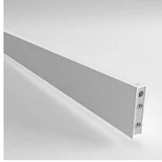
40157 Joint Eye