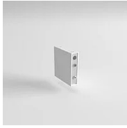
40155 Joint Eye