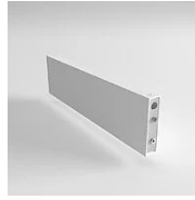
40156 Joint Eye